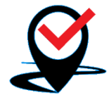
SMA.I.L.: Proof of Delivery