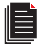
SMA.I.L.: Scansione Documentale