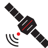
SMA.I.L.: Sat Connect