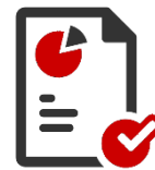
SMA.I.L.: TMS Analytics