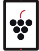
SMA.I.L.) 2 MIPAAF

In particolare comunica automaticamente con: