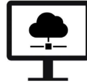
SMA.I.L.) Dogana Connector